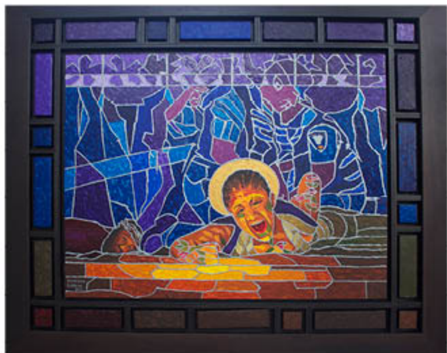
PABLO MARCANO GARCÍA (Puerto Rico) Virgen de la Lucha , 2012 Acrylic on canvas, 52" x 62"